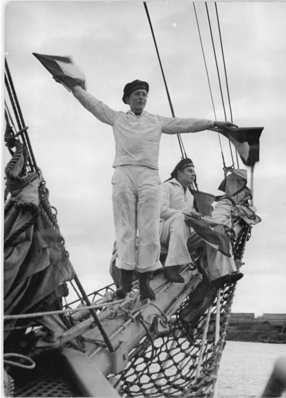
27. Dezember 1951